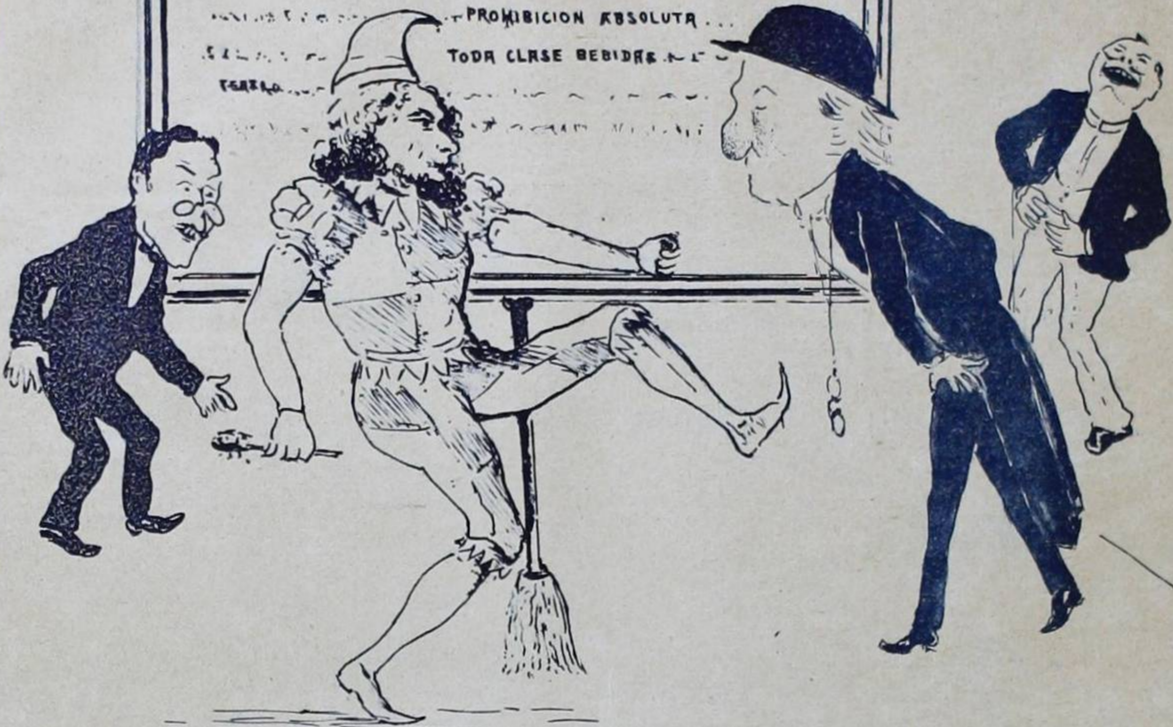
FINAL DE OPERA (TEATRO NACIONAL)