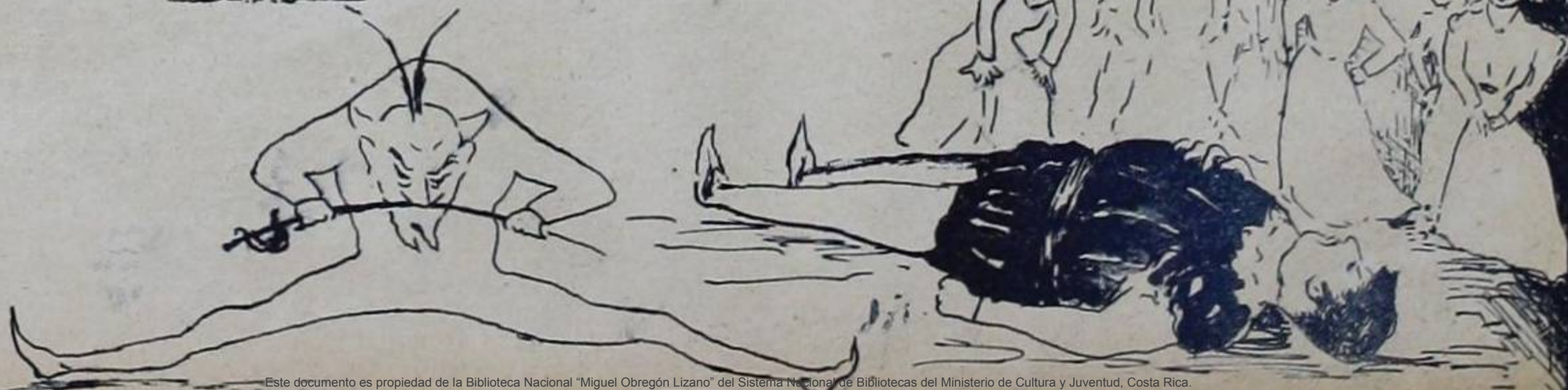
MEFISTOFELÉS DELANTE DELA CRUZ

...¡ DIO POSSENTE BELZEBÚ...! (DICEN QUE ES EXAJERADO !... ES SIEMPRE UN GRAN ARTISTA.)